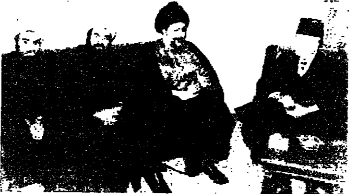
بعد زيارة القصر قام الرئيس سركيس بتفقد زيارته معسكر الجيش الشبيبي الأعلى فاستقبله سماحة الامام موسى الصدر بحضور الشيخ محمد مودي شمس الدين ، ثم استقبل الامام الصدر سركيس الكونت السيد عبد الحميد البيمان

الزيارات للقصر الجمهوري أمس كانت محدودة ، بسبب انهيار الرئيس سركيس بحلة الابن البلاد ، بعد حادث الاشارة وما تبعه .